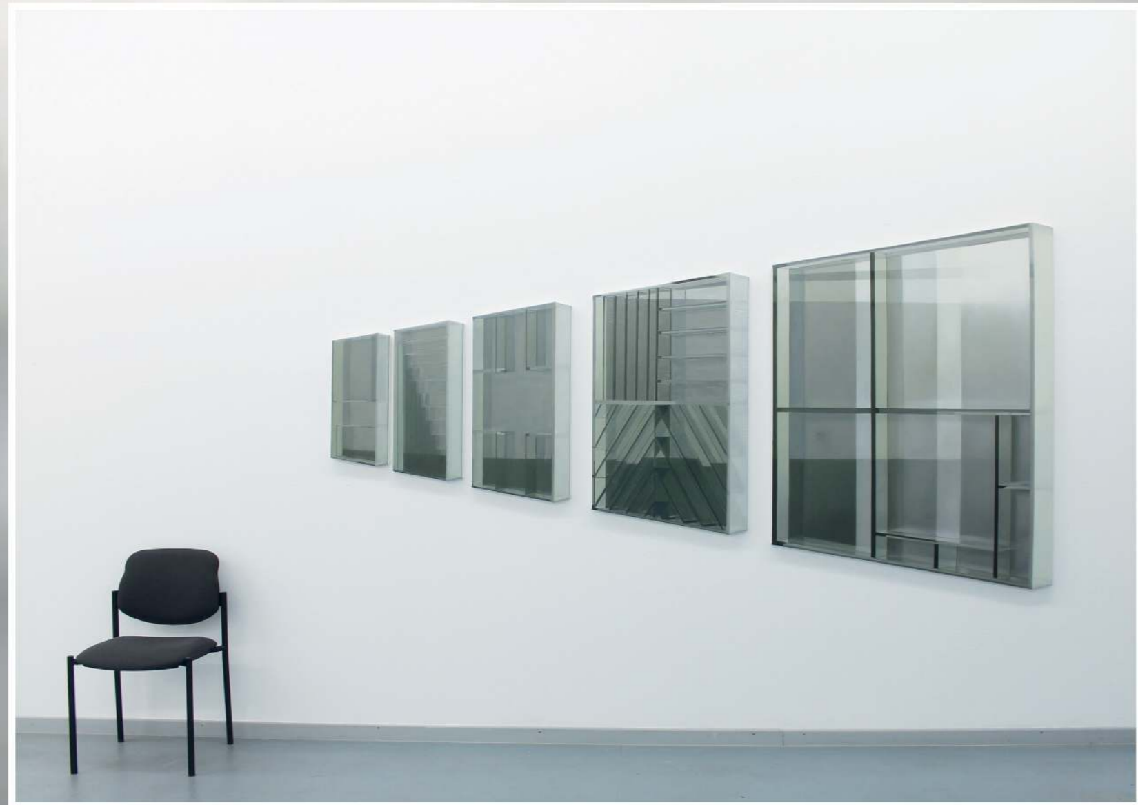
Wenn die großen Meister keine Farben hätten , 2017, Pentaptychon, Öl und Epoxy auf Leinwand, 5 Bilder, insgesamt ca. 306 x 156cm 156 x 120 cm, 110 x 65 cm