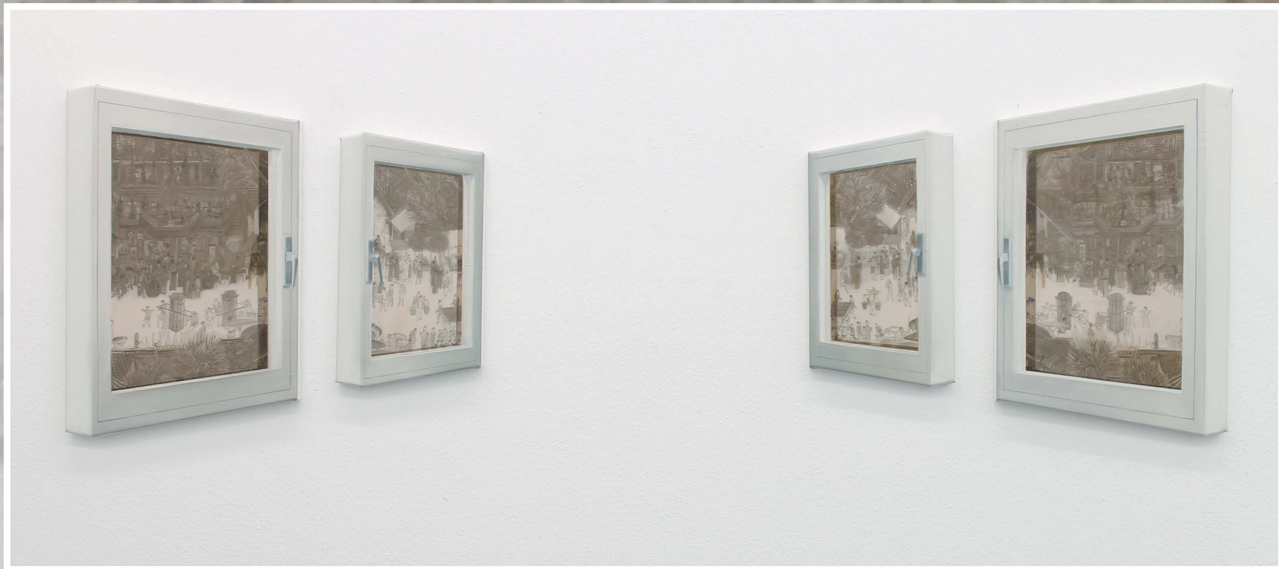
Tetraptychon (Qingming-Rolle), 2017 Öl und Epoxy auf Leinwand, 4 Bilder, insgesamt 65 x 217 cm