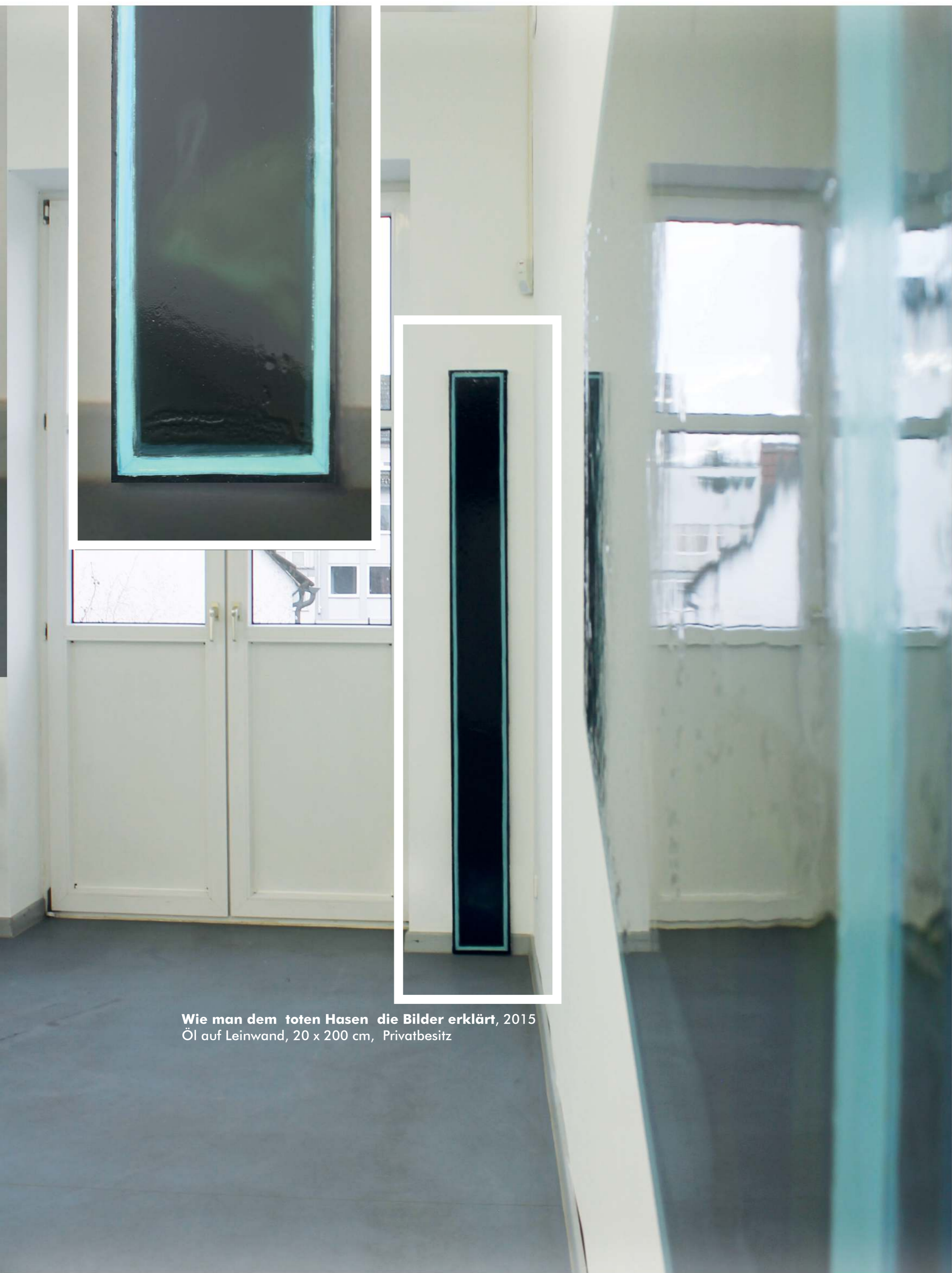
Wie man dem toten Hasen die Bilder erklärt , 2015 Öl auf Leinwand, 20 x 200 cm, Privatbesitz