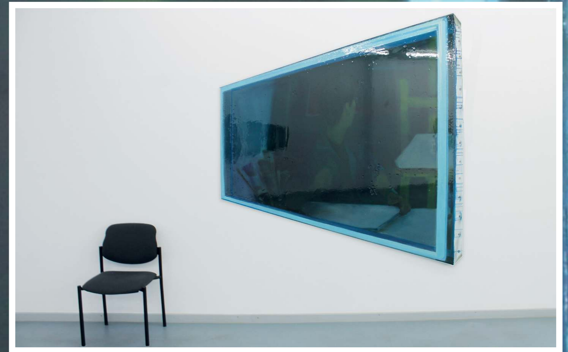
Die Malkunst, 2015 Öl auf Leinwand, ca. 200 x 200 cm, Privatbesitz

Nicht nur verbindet Chung zentrale Topoi der Selbstreflexivität der Renaissance-Malerei (Fenster, Spiegel) mit weit älteren Traditionen der christlichen Malerei (mit der vera icon hat er sich in einer früheren Arbeit beschäftigt). Er konfrontiert auch die scheinbare Asepsie und Sterilität der Hochkunst für den White Cube mit den Mühen des Machens.