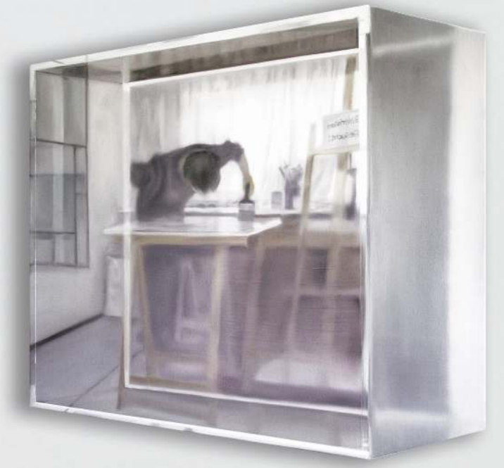
Der Künstler in seinem Atelier I-V, 2017

Öl und Epoxy auf Leinwand, je ca. 100 x 100 cm