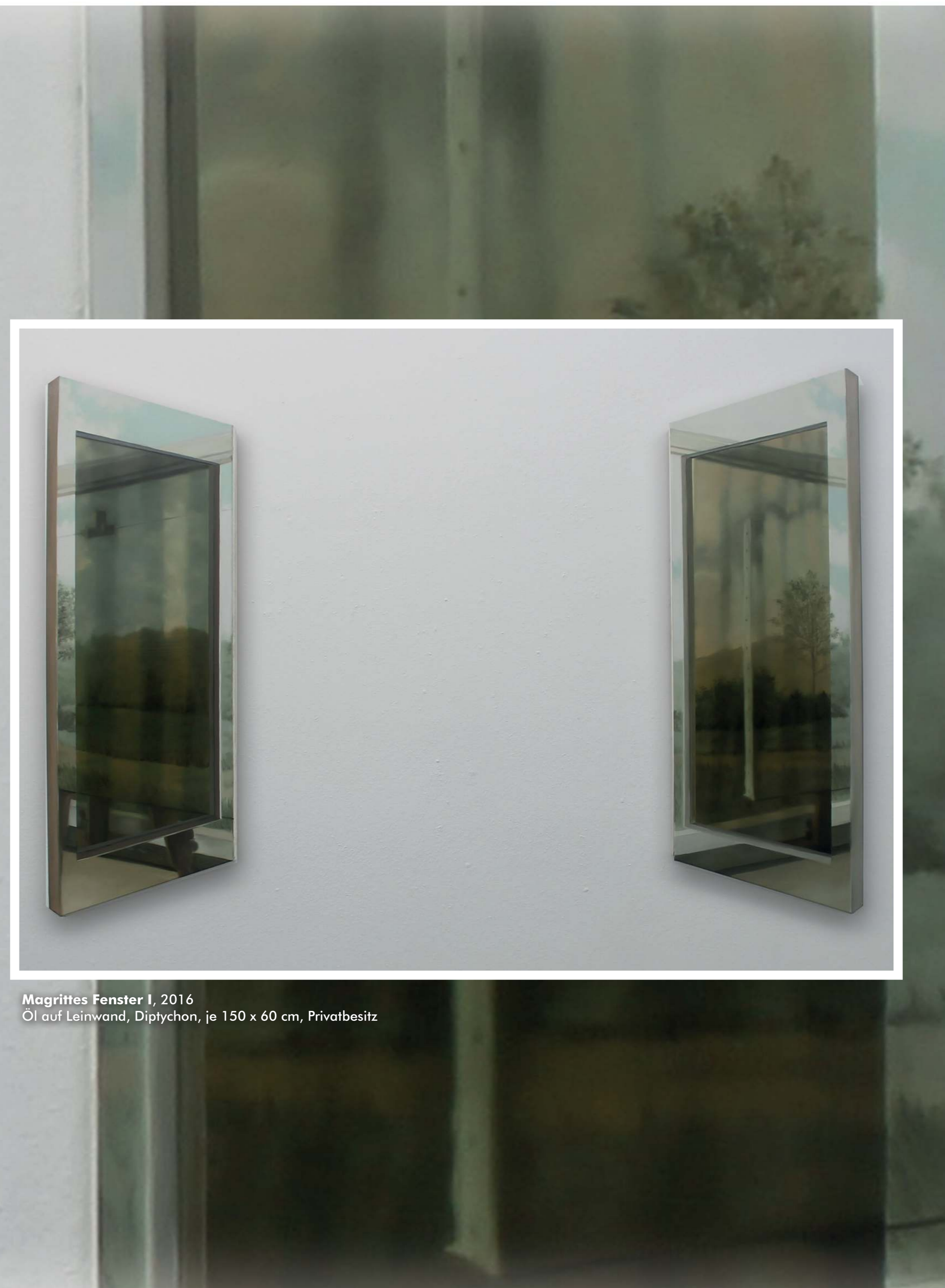
Magrittes Fenster I , 2016 Öl auf Leinwand, Diptychon, je 150 x 60 cm, Privatbesitz